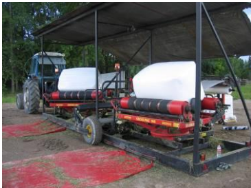
Förpackning av storbalar