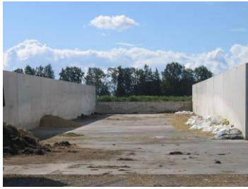
Plansilos utan vägg bak