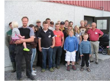
Alla deltagare i resan