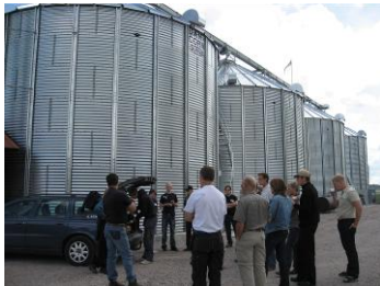
Spannmålstorkar på Örby Gård