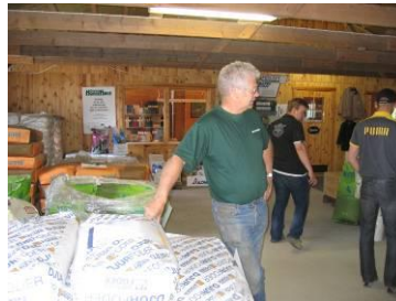
Gårdsbutik – hästfoder