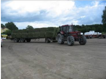
Höbalar på väg in...

En nybyggnation pågick i en hall för 60 dikor. Man satsar på djupströboxar eftersom man har god tillgång till egen halm (som också säljes). Hallen bygges med plant golv och upphöjt (80 cm) körbart foderbord. Syftet är att hallen lätt ska kunna ändras till annan användning om behov uppstår i framtiden.