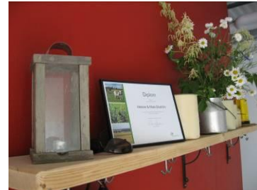
Ingången till ladugården