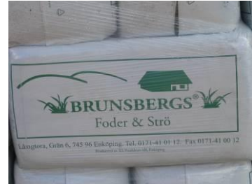
... slutprodukt .