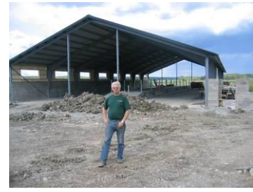
Nybyggnation av dikostall